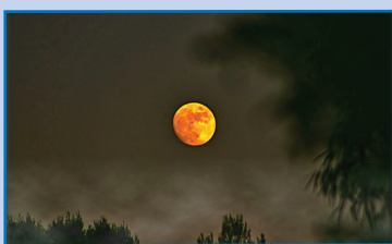
„Der rote Mond“