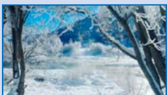
„Winterlandschaft bei der Murinsel in St. Michael“ Bild des Monats eingewählt von Roland Holitzky